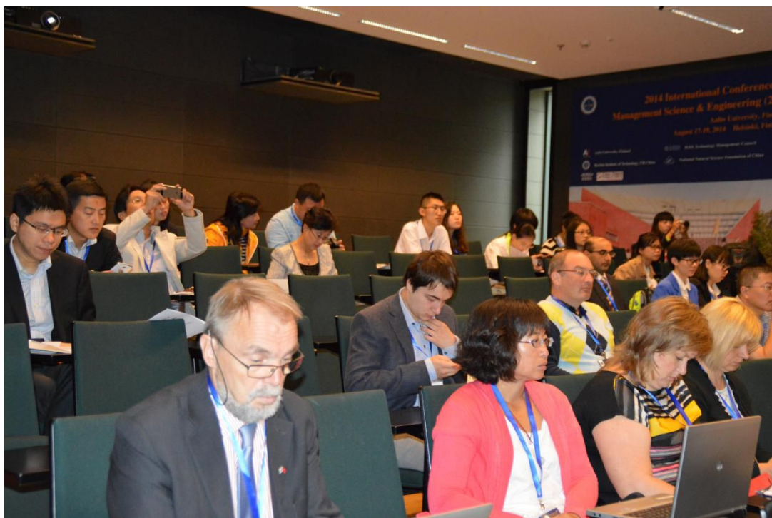
2014 International Conference on Management Science and Engineering (ICMSE) August 17-19, 2014 Helsinki, Finland