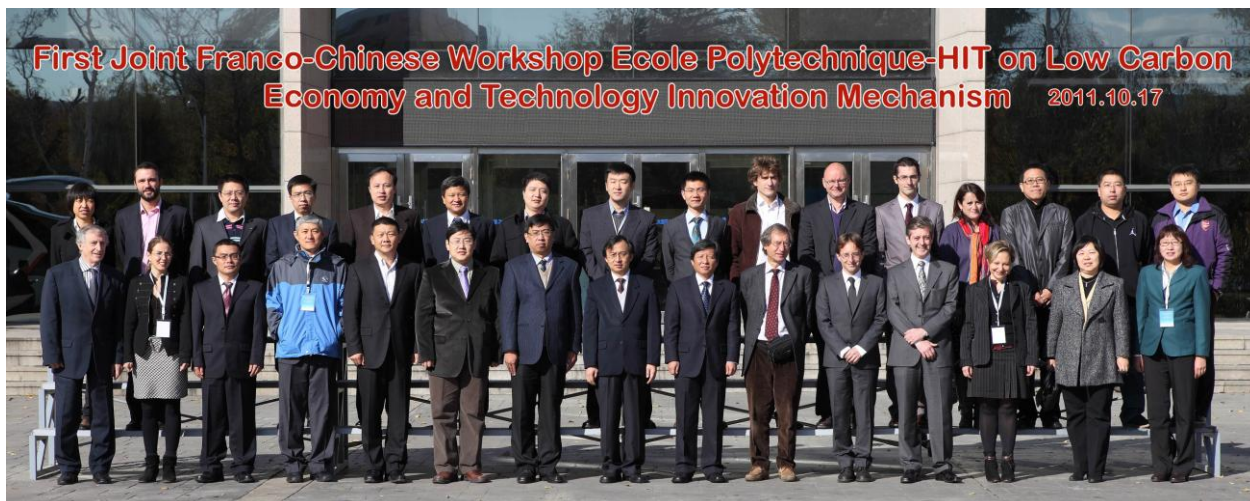
第一届中法低碳经济及技术创新机制研讨会合影

2011 年 10 月 17 日至 18 日在哈工大科技园召开了“中法第一届低碳经济与技术创新机制学术研讨会”。会议受到国家发改委、国家自然科学基金委及法国驻华使馆的大力支持，吸引了包括法国巴黎综合理工大学，法国矿业大学、法国电力集团、发改委能源研究所、亚洲开发银行、中科院政策所、国家电网及中国投资银行等中法两国政府机关、科研院所、高校知名学者及知名企业代表参加。与会嘉宾共做报告 18 次，精彩纷呈，既探讨了国家节能减排、应对气候变化的宏观政策问题、还就行业节能减排、发展低碳经济的微观技术问题进行了交流。